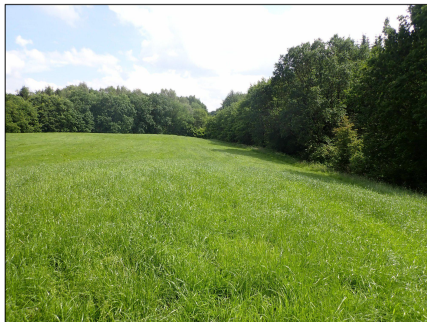
Blick von der westlichen Ecke des Flurstücks nach Südosten; geplante Gehölzpflanzung entlang des Knicks mit einem Abstand von 7 Metern zur Flurstücksgrenze.