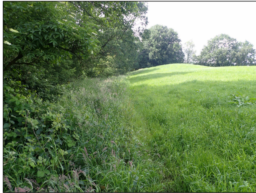
Blick wie oben mit Knickrand und Saum