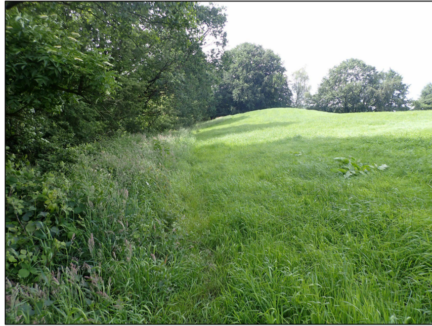
Blick von der südlichen Ecke des Flurstücks nach Nordwest entlang des parallel zum Waldrand verlaufenden Knicks bis zum nördlichen Rand des Flurstücks